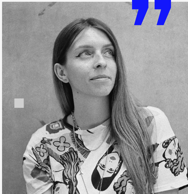
dr IVONA TAU

Artystka nowych mediów z Wilna (Litwa), tworząca na styku sztucznej inteligencji i sztuki. Pracuje z sieciami neuronowymi i kodem w obszarze eksperymentalnej fotografii oraz malarstwa ruchomego (motion painting). Jej celem jest poszukiwanie i wywoływanie emocji przy użyciu narzędzi opartych na sztucznej inteligencji. Tworzy uniwersalne, poruszające wspomnienia, przekształcając własne doświadczenia uchwycone na analogowym i cyfrowym filmie za pomocą generatywnych sieci neuronowych (GAN). Tau działa na styku sztuki i technologii, z 15-letnim doświadczeniem łączącym profesjonalną fotografię i badania nad sztuczną inteligencją.